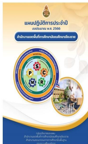
แผนปฏิบัติการประจำปีงบประมาณ พ.ศ. 2566