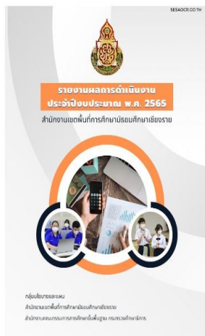
รายงานผลการดำเนินงานประจำปีงบประมาณ พ.ศ. 2565